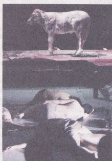
Die Rückkehr zu den alten Göttern scheidet.

Das Scheitern aller Bemühungen bringt in der Oper der zweite Akt. Als Moses auf den Berg steigt und lange nicht zurückkommt, wird das Volk unruhig und ungläubig. Es ruft nach seinen alten Göttern, und Aron, der zunächst Widerstand leistet, gibt schließlich nach. Das Volk schafft sich sein Gottesbild im Goldenen Kalb. Wie in der Bibel scheidet die Rückkehr zu den alten Göttern. Moses kehrt zurück und zer-