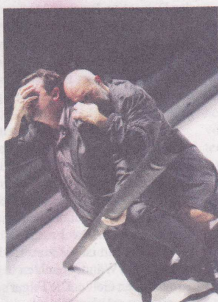
Moses und Aron: Konflikte sind vorprogrammiert.